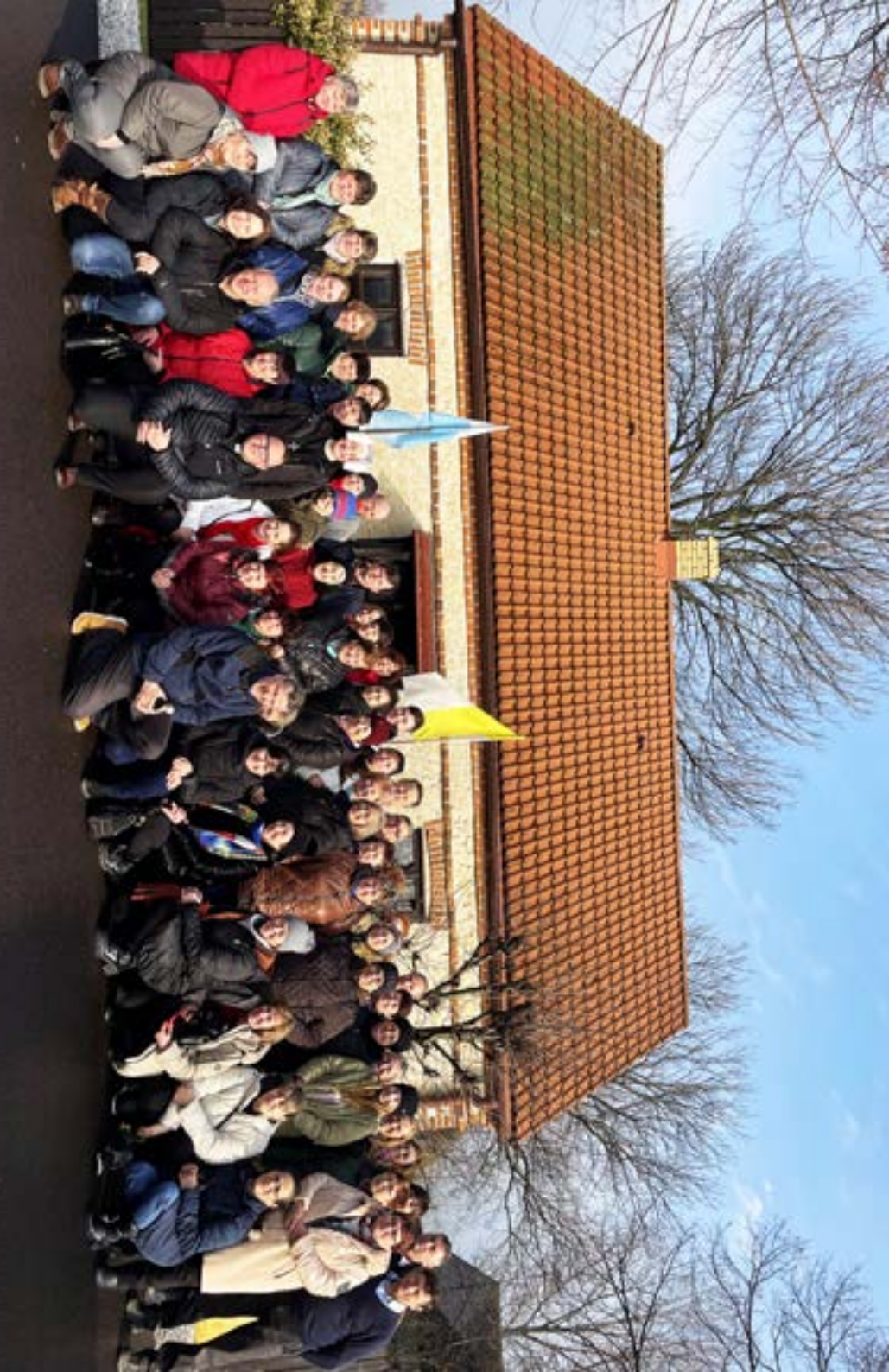
Rodný dom sv. sestry Fuštiny Kowalskej v Glogowci