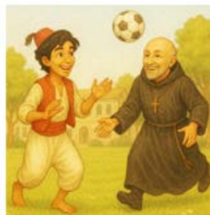
UTOROK | ŠPORTY | ALADIN | SVÄTÝ IGNÁC Z LOYOLY

Pane Ježišu, ďakujeme Ti, že sme sa dnes zobudili do nového dňa. Za slnko, za kamarátov, za animátorov, za smiech aj hry, ktoré nás čakajú. Ďakujeme Ti aj za to, že si nám dal svätého Jána Bosca, kňaza s veľkým srdcom, ktorý veril, že aj deti z ulice, tie najchudobnejšie a neposlušné, majú v sebe niečo krásne. Vidiš to aj Ty, aj keď to niekedy nevidíme ani my sami. Tak ako svätý Ján Bosco povzbudzoval svojich chlapcov, aby verili, že Boh s nimi ráta, tak aj Dumbo, malý slon s veľkými ušami napriek výsmechu ukázal, že dokáže veľké veci. Vedel lietať. Nie preto, že by bol silný, ale preto, že veril a mal po boku priateľa, ktorý ho povzbudil. Daj nám dnes radosť, odvahu a otvorené srdce, aby sme boli ako svätý Ján Bosco, plný lásky, trpezlivosti a dôvery v Teba. A keď sa budeme cítiť smutní alebo zbytoční, pripomeň nám Dumba, ktorý sa naučil lietať, a že aj my môžeme, keď Ti budeme dôverovať. Amen.