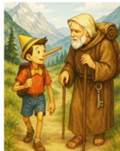
ŠTVRTOK | STOPOVAČKA | PINOCCHIO | SVÄTÝ PETER