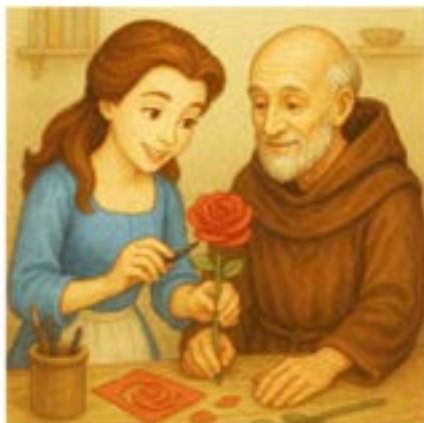
STREDA | WORKSHOPY (BOZPRÁVKOVO) | KRÁSKA & ZVIERA | SVÄTÝ FRANTIŠEK Z ASSISI

slávu a obdiv, no potom pochopil, že Tvoja vôľa je viac než všetky poklady. Učil nás rozlišovať, čo pochádza od Teba a čo nie. Pane, daj nám dnes múdrosť, aby sme si nevyberali to, čo len žiari, ale to, čo vedie k láske. Pomôž nám hľadať nielen to, čo chceme, ale to, čo naozaj potrebujeme. A keď budeme stáť pred rozhodnutím, daj nám vnútorný pokoj ako kompas, ktorý ukazuje na Teba. Amen.