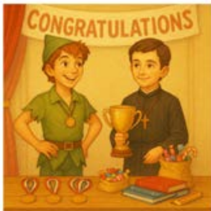
PIATOK | VYHODNOTENIE | PETER PAN | SVÄTÝ DOMINIK SAVIO